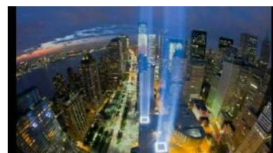
Un lugar para Lorenzo Silva