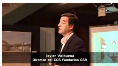
Presentación de la 5ª fase de Territorio Ebook con Lorenzo Silva