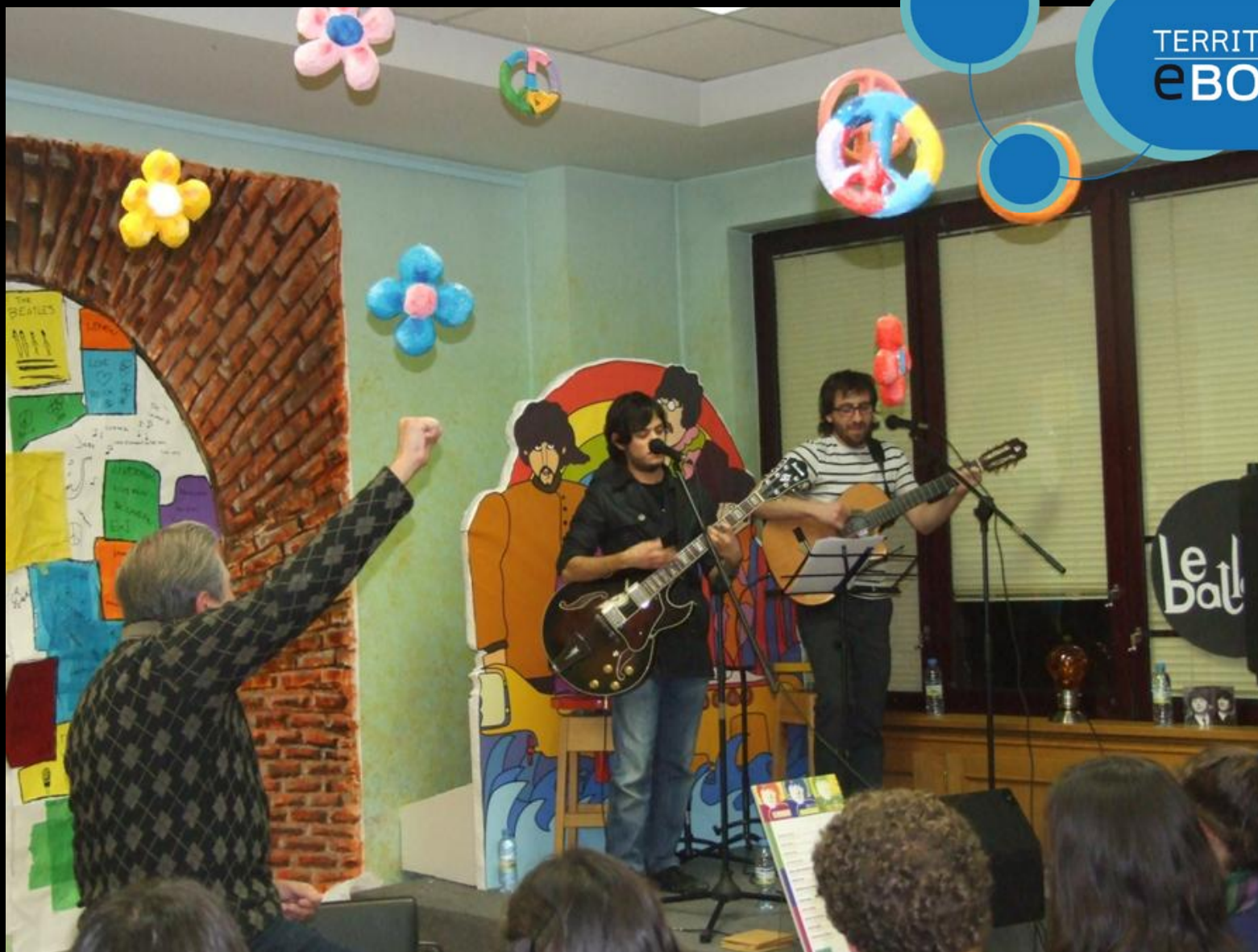
Más música de los Beatles para emocionarnos