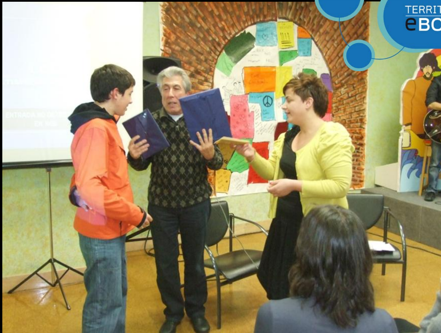
Los ganadores del concurso de cómic...