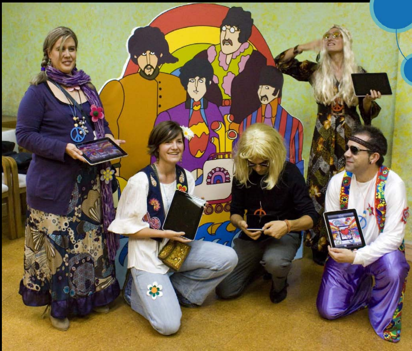
Unos iPad-tecarios muy hippies