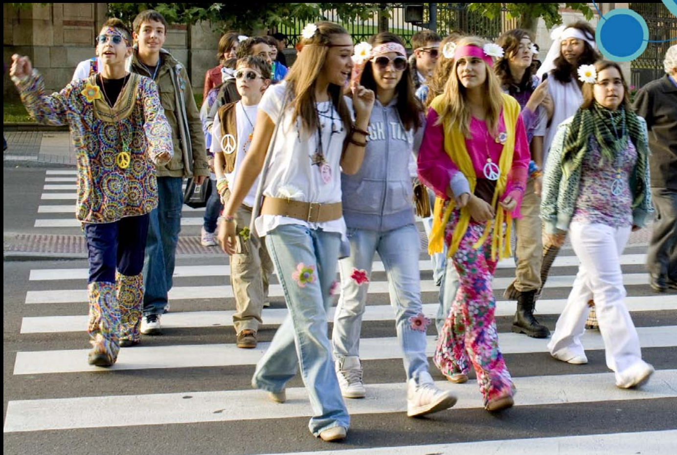
Cruzando Abbey Road